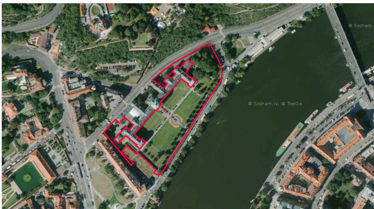
Lokalizace řešeného území