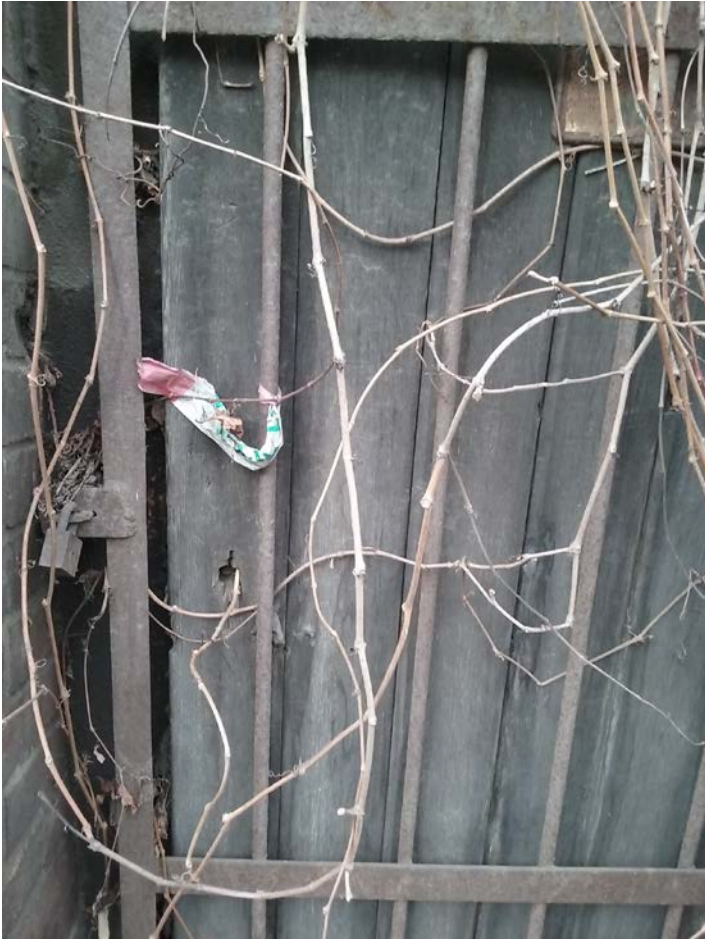
Fotografie stávajících dveří: